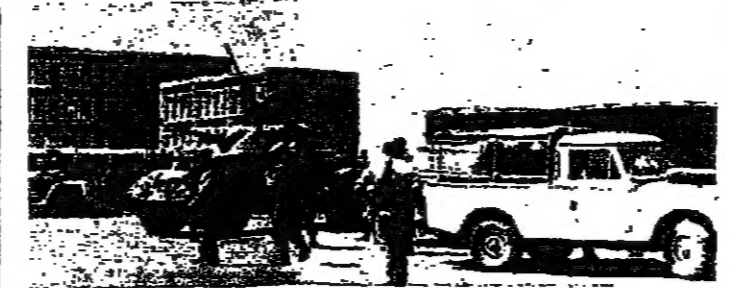
توى الان في منطقة القولة عند منع الصهاريج من العمل

ترس مشروع الاتفاق التجاري بين لبنان وسوريا... عقدت اللجنة الثنائية المتابعة عن الجانب اللبناني في الهيئة الدائمة المشتركة اللبنانية السورية اجتماعتها في وزارة الخارجية والمغتربين ، برئاسة الدكتور عماد حيدر مجسر الشؤون الاقتصادية في الوزارة ، وعرضت خلاله مشروع الاتفاق التجاري بين لبنان وسوريا ،